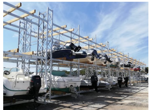
2. Pérols Port à Sec / Montpellier

Las estructuras Nautirack han sido diseñadas y calculadas para resistir a la manutención con carretilla elevadora y a la colocación de barcos . Todos los cálculos elastoplásticos se han realizado en conformidad con la normativa europea vigente (FEM 10.2.02). Además de estos análisis estadísticos, se han llevado a cabo estudios de resistencia mecánica, con cargas climáticas y sísmicas (ráfagas de viento, efecto de arrastre...). Dichos cálculos permiten obtener una estructura NAUTIRACK completamente conforme con las exigencias normativas EUROCODE 1 y con la reglamentación parasísmica . Galvanizadas en caliente según UNE-EN/ISO 1461