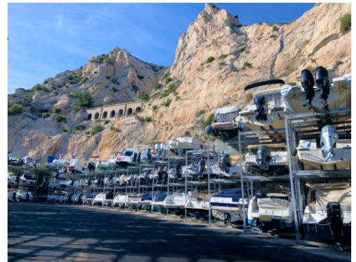
1. 400 embarcaciones "puerto seco" Marseille, l'Estaque.