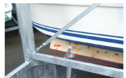
1. Detalle de la pendiente para desagüe